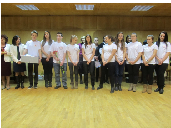
Szkolne Koło Wolontariatu „Promyki Dobra”, Zespół Szkół w Czarnowąsach