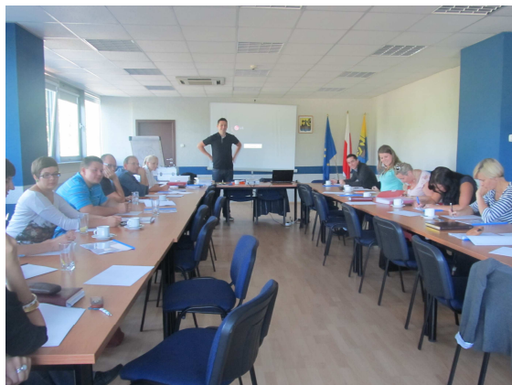
Szkolenie w ramach standaryzacji Inkubatorów.

OPOLSKIE CENTRUM WSPIERANIA INICJATYW POZARZĄDOWYCH Członek Sieci SPLOT